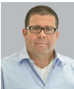
פרופ' יורם רבין נשיא המכללה למינהל